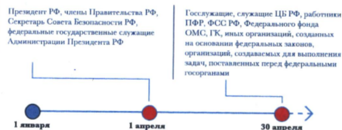
Схема 1 Сроки представления сведений

8. Сведения могут быть представлены служащим (работником) в любое время, начиная с 1 января года, следующего за отчетным.