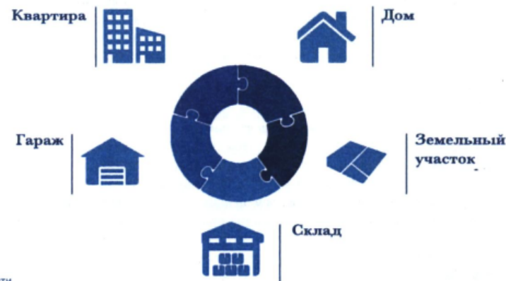
Схема 2. Основные объекты недвижимости

61. Указанию также подлежит недвижимое имущество, полученное в порядке наследования (выдано свидетельство о праве на наследство) или по решению суда (вступило в законную силу), право собственности на которое не зарегистрировано в установленном порядке (не осуществлена регистрация в Росреестре).